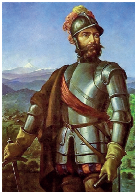
Sebastián de Belalcázar.

Dos hombres con teas para alumbrarse, ya entrada la noche, ingresan al Templo del Sol. Deslumbrados ante la gran cantidad de objetos de oro que adornan el adoratorio, tiran las antorchas para abarcar en sus brazos libres el mayor número de joyas. El templo, construido en madera, con techo de paja, prende fuego y arde en segundos.