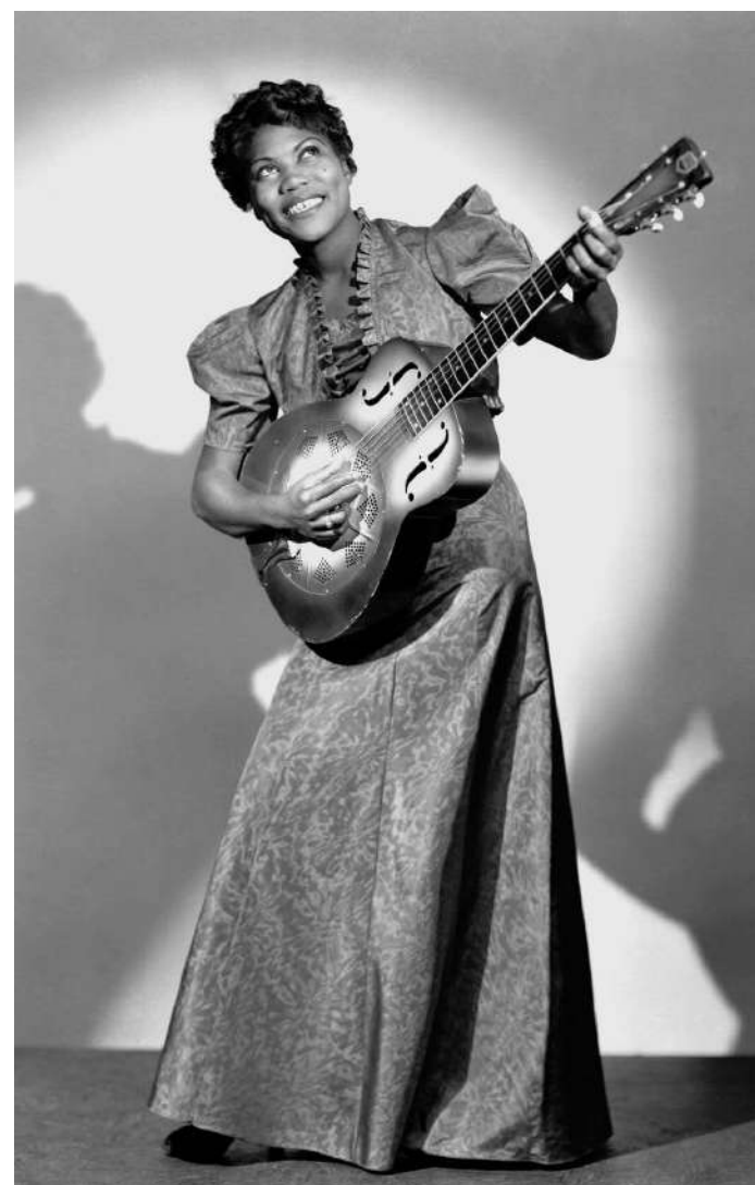
Sister Rosetta Tharpe. Fue ella quien realmente inventó la guitarra eléctrica.