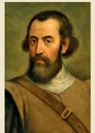
Alfonso de Heredia

sin haberse enterado de la muerte de Tisquesusa ni de la elección de Sagipa, pero ya dueño de la sabana, Jiménez de Quesada mueve el 2 de junio su ejército hasta Turmequé poblado que bautiza con el nombre de Valle de la Trompeta. El 27 de junio, desde el pueblo de San Juan el licenciado Quesada destaca al capitán Juan de San Martín para explorar los llanos Orientales.