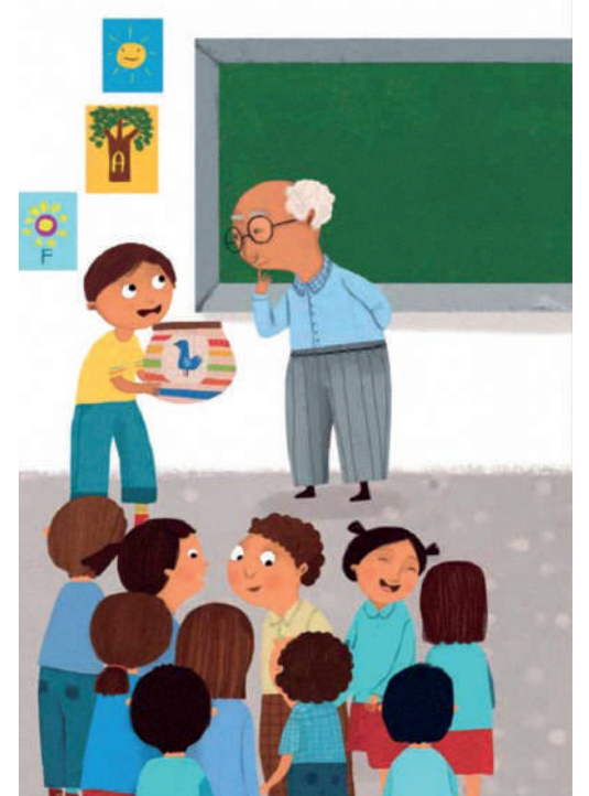
Ilustraciones Claudia Navarro

El silencio fue sepulcral. Parecía que Rodrigo era el único que había hecho la tarea.