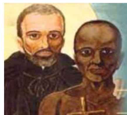
San Pedro Claver, Misionero Jesuita, defensor de los esclavos (1580 España-1654 Cartagena de Indias)

del cual conocimos sus relatos, pero también los documentales, películas y series, nos muestra lo asombroso y complejo que es el ser humano, su sabiduría, conocimientos y tecnología, lenguas, formas de organización y de poder, riqueza material, pero también el andante nos enseña, las limitaciones humanas, las consecuencias de la avaricia, el atesoramiento y la idolatría al mismo poder, que lleva a aceptar como benévola la misma esclavitud, la explotación de hombres, mujeres, niños y ancianos.