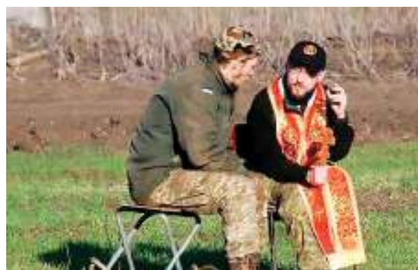
Un capellán ucraniano, en primera línea

Las diferentes miradas que brinda la historia y la actualidad para conocer el mundo, las diferentes culturas, razas, formas de organización y creencias, son muchas y variadas, desde los viajes, del mismo Marco Polo (8 de enero de 1324+) ese veneciano de la edad media,