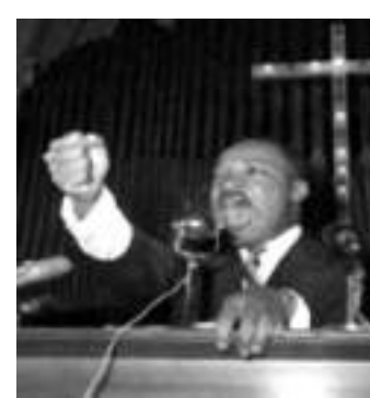
Martin Luther King, Pastor Bautista y defensor del derecho de los negros en los Estados Unidos (1929 Atlanta-asesinado en 1968 en Memphis, Estados Unidos)

El sueño de la libertad y la igualdad, el sueño de la justicia, el sueño del amor y el sueño del perdón, hacerlos una realidad llevó al mismo Cristo Jesús al sacrificio, no bastó su muerte, sus milagros no fueron suficientes, ni sus palabras y obras, se saciaron del pan y los peces, presenciaron como revivió muertos, como limpio leproso, alivio inválidos y saco demonios, domino las mareas y los vientos, caminó sobre el agua, perdonó pecados, venció la muerte y resucitó, pero nada les fue suficiente para los