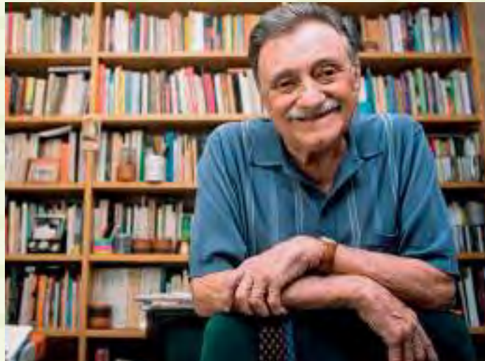
A continuación, me permito transcribir el siguiente poema, uno de los más conocidos de Benedetti:

Desde entonces aumentará su participación política y vivi-