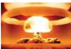
Bienvenidos al Antropoceno: la época geológica forzada por el hombre

Veintinueve miembros de la Comisión, además de apoyar la denominación Antropoceno, votaron a favor de establecer el inicio de la nueva época a mediados del siglo XX, cuando una población humana en rápido crecimiento aceleró el ritmo de la producción industrial, el uso de productos químicos agrícolas y otras actividades. Al mismo tiempo, los primeros ataques y ensayos nucleares "contaminaron el planeta con residuos radiactivos que se incrustaron en los sedimentos y el hielo glacial, convirtiéndose en parte del registro geológico", indica Nature.