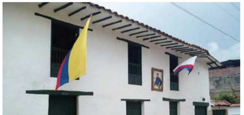
Casa Memoria José Antonio Galán - Charalá.

Por: Myriam Sanabria* Especial para Gaceta Republicana