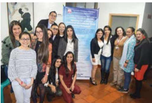
Grupo de estudiantes de la Facultad de Trabajo Social.