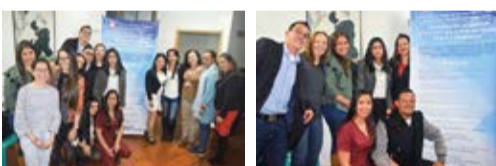
Grupos de estudiantes de la Facultad de Trabajo Social.

"Seminario Jurídico Ambientalista" organizado por la Facultad de Derecho, Área de Derecho Privado, realizado el 20 de mayo de 2019 en el aula máxima de la Corporación.