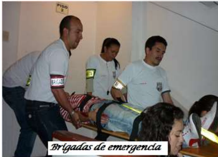
Brigadas de emergencia