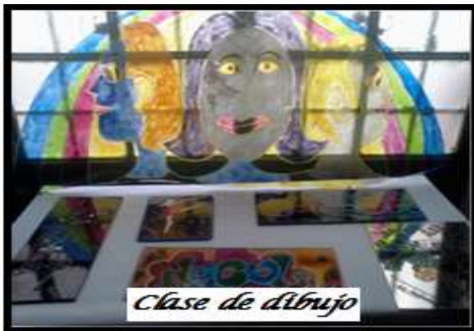
Clase de dibujo