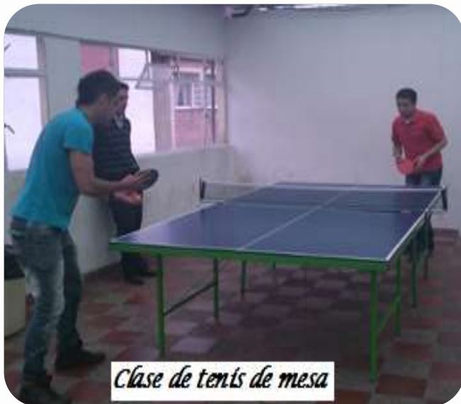
Clase de tenis de mesa

Esta área esta dirigida a promover el uso del tiempo libre, a través de actividades de carácter deportivo a nivel recreativo, formativo y competitivo, que permitan motivar la práctica del deporte y fomentar el espíritu de superación a través de una sana competencia, estimulando el desarrollo de aptitudes deportivas, la formación correspondiente, y la participación de toda la comunidad.