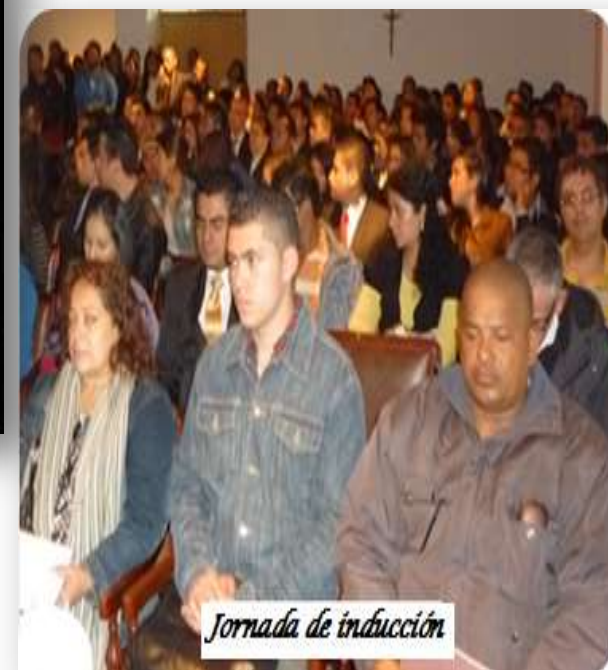
Jornada de inducción