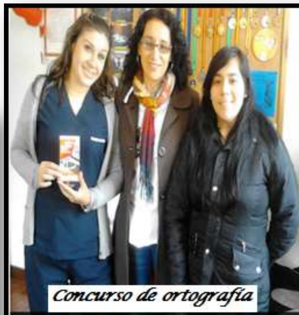
Concurso de ortografía