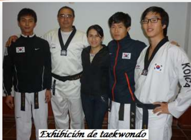
Exhibición de taekwondo