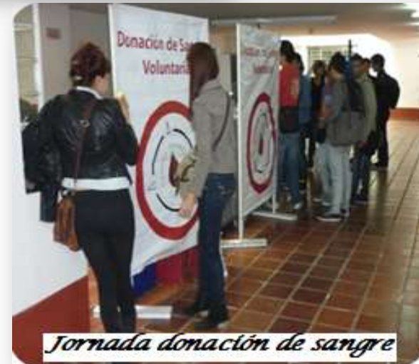
Jornada donación de sangre