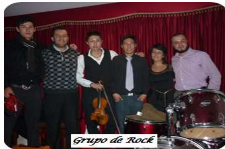
Grupo de Rock