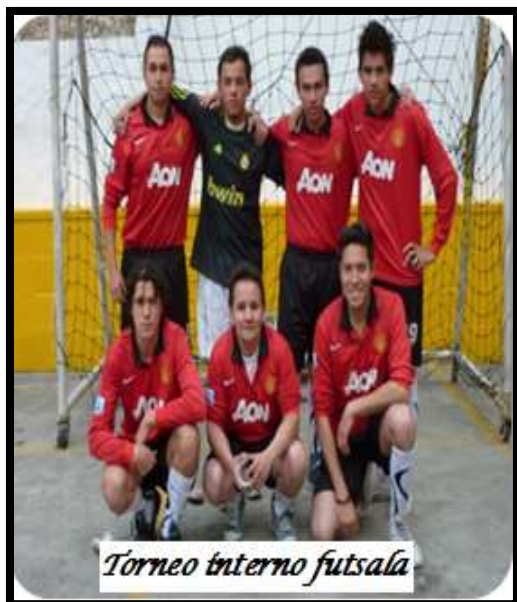
Torneo interno futsal