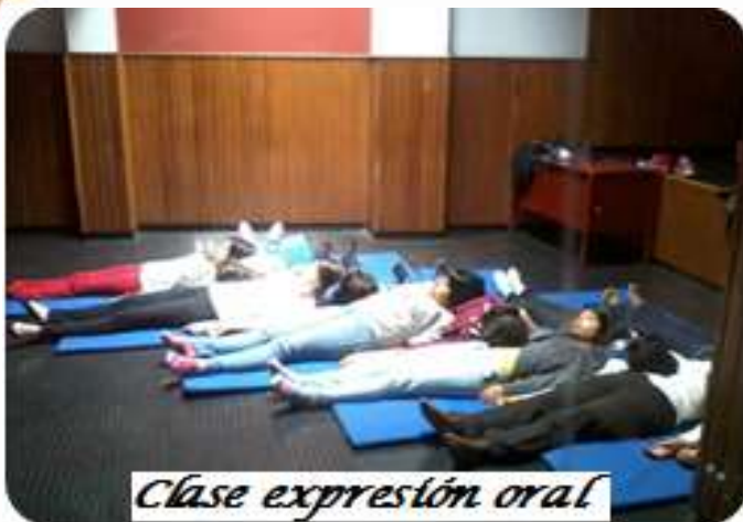
Clase expresión oral