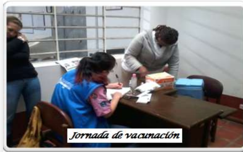
Jornada de vacunación