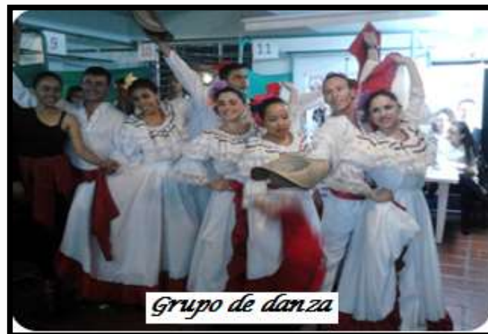
Grupo de danza